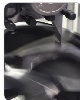
Diamond Cut СТРУГОВАНЕ