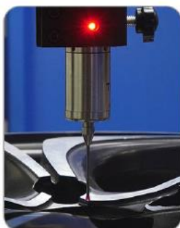
СЧЕМАНЕ НА ПРОФИЛА