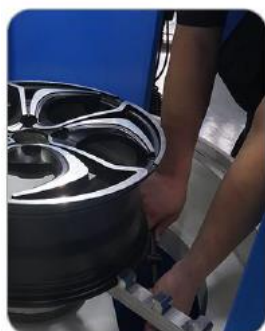
ПОЗИЦИОНИРАНЕ НА ДЖАНТАТА